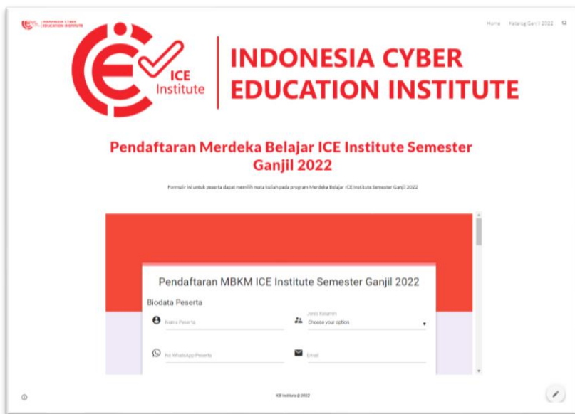
Gambar 3 Form Pemilihan Mata Kuliah Bagi Peserta

Perguruan tinggi memasukan alamat email mahasiswa (alamat email resmi dari setiap Perguruan tinggi), memilih maksimal lima (5) mata kuliah dari PTN/S dalam negeri yang tersedia pada ICE Institute, dua (2) mata kuliah dari edX, dan/atau dua (2) mata kuliah dari XuetangX yang ditawarkan seperti yang terlihat pada gambar 3 di bawah ini.