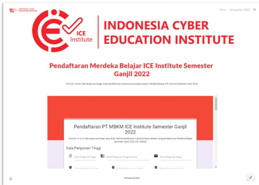
Gambar 1 Tampilan Form Pendaftaran Beasiswa oleh Perguruan Tinggi

https://sites.google.com/view/iceidaftar/ptdaftarganji12022 .