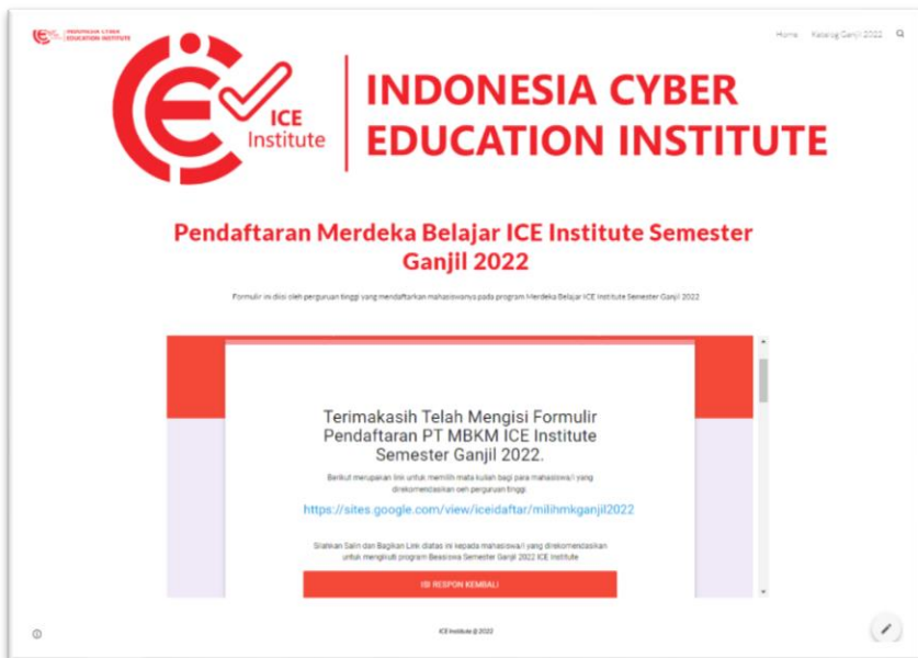
Gambar 2 Link Form Pemilihan Mata Kuliah akan di tampilkan saat perguruan tinggi telah mengirimkan dokumen Pakta Integritas dan Rekomendasi

Selanjutnya, pada tampilan ini juga terdapat link form yang dapat digunakan untuk mendaftarkan mahasiswa sebanyak yang direkomendasikan.